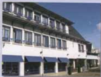
HOTEL "LES GLENAN" RESTAURANT "CHEZ JULES"

17 RUE DE LA POSTE 29980 BENODET TEL 02 98 57 17 08